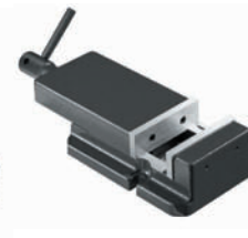
Etau EP 120 BF