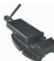
Etau EP 100 BF