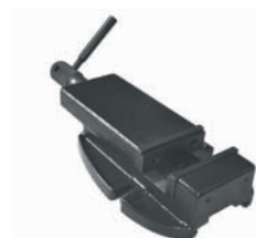
Etau EP 100 BF