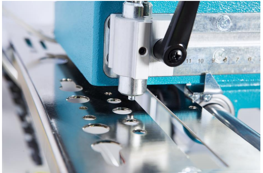
Modèle FR 223 S avec système de lubrification

Fraiseuse à copier verticale portable ( par gabarit ou système de butées ) qui, grâce aux dimensions réduites et au faible encombrement des pièces mécaniques s'avère particulièrement adaptée pour un emploi direct sur les chantiers du bâtiment.