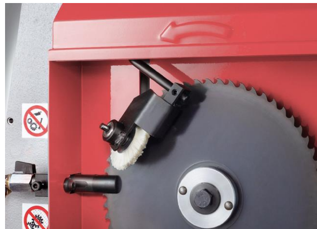
Brosse à copeaux