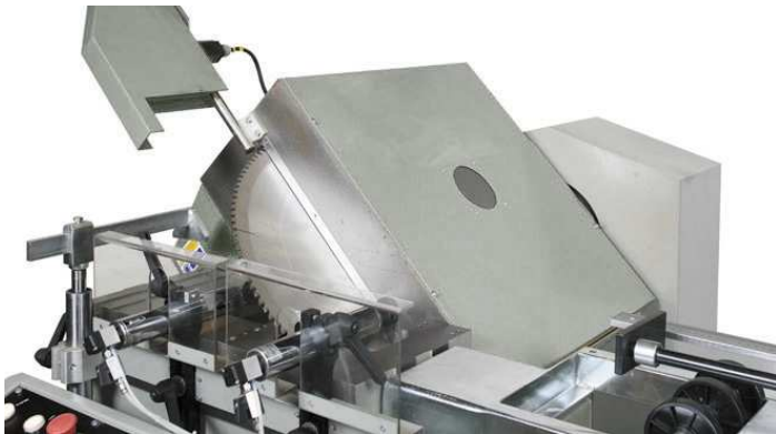
Pivotement de la tête à 45°

De plus, une butée mécanique permet le pivotement aux angles intermédiaires.