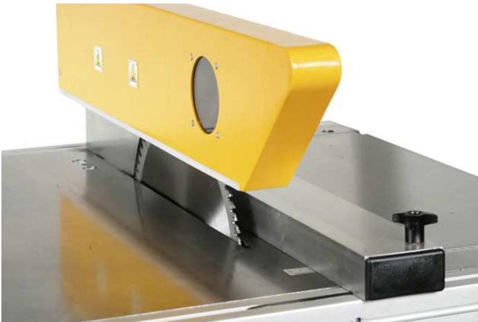
Carter de protection lame