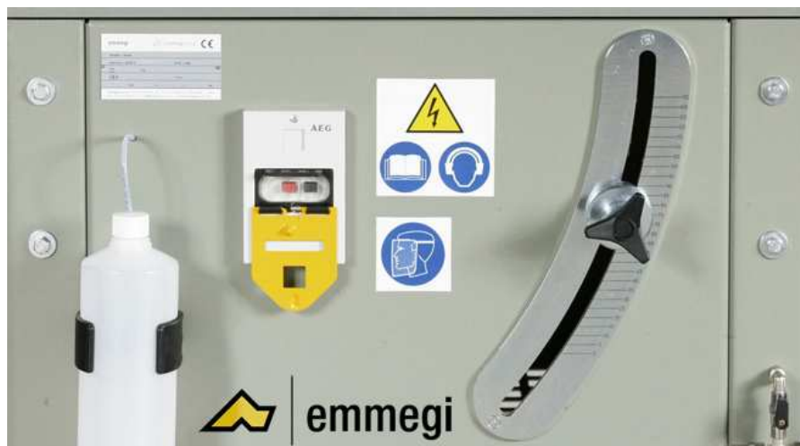
Butée réglable de la sortie de lame

Cette machine montée sur bâti fixe robuste, est équipée avec :