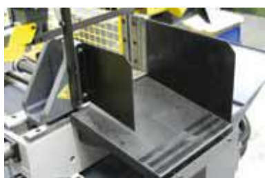
Guide pièces coupées