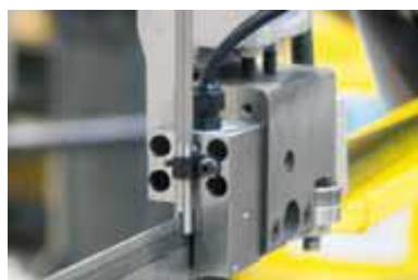
Palpeur déviation ruban

PROLINE 280 H / PROLINE 350 H PROLINE 450 H