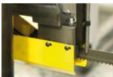
Bloc de guidage ruban