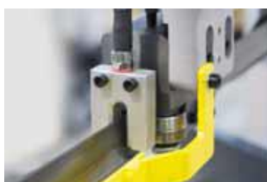
Buse de micro-pulvérisation