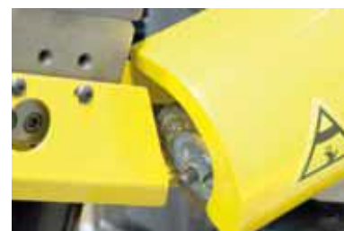
Brosse à copeaux