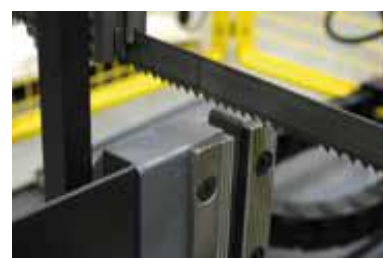
Etau principal serrage Amont/Aval