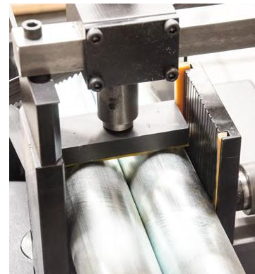
Serrage vertical (en OPTION)