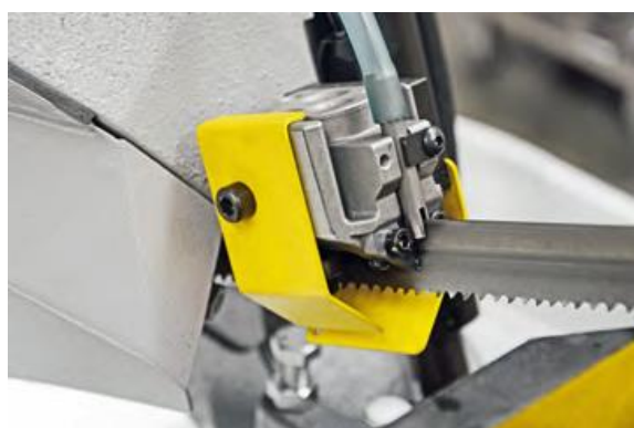
Bloc de guidage ruban