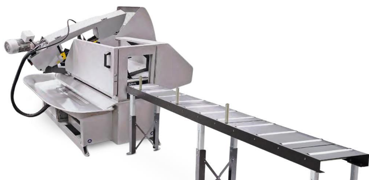
Scie en situation avec chemin BA 330 M