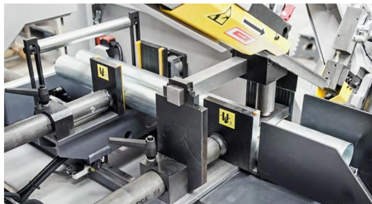
Etau de serrage et avance-barre