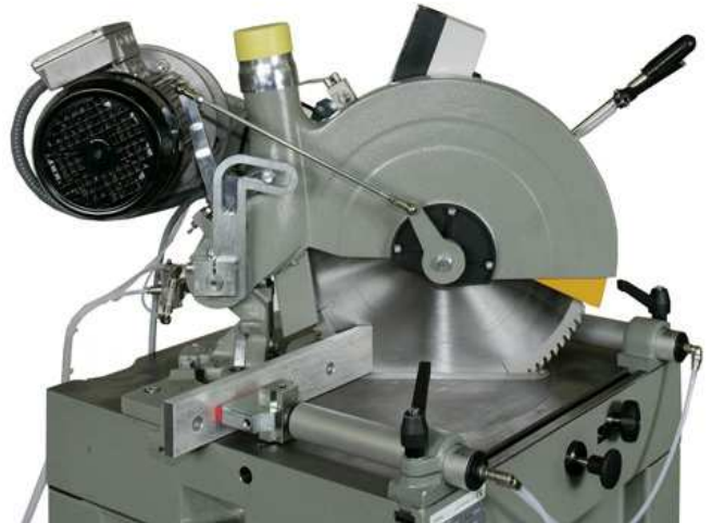
Pivotement 45° à gauche et à droite

Plateau tournant monté sur couronne à aiguilles. Plateau de base en fonte avec rainure en T pour le positionnement des étaux.