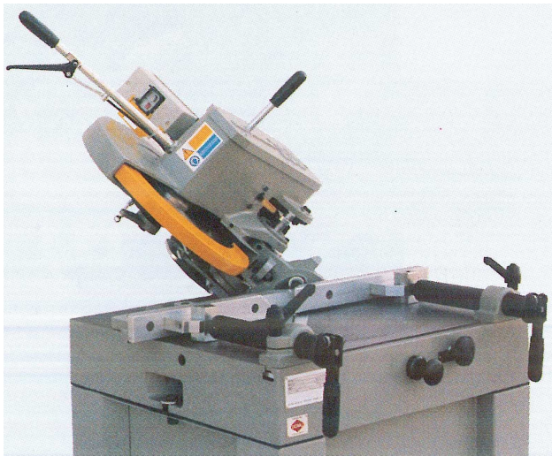
Pivotement 45° par rapport à la verticale