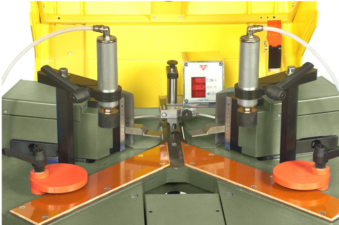
Détails des butées et des poinçons