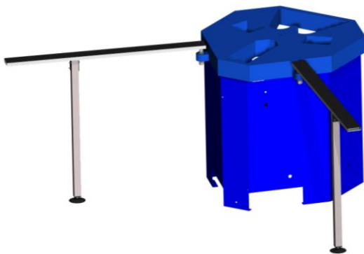
2 bras support pivotants (standard)