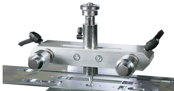
Doigt de copiage.