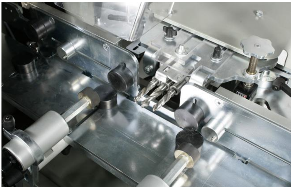
Tête de perçage à 3 broches & serrage pneumatique par 2 vérins