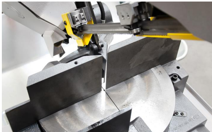
Grand plateau tournant