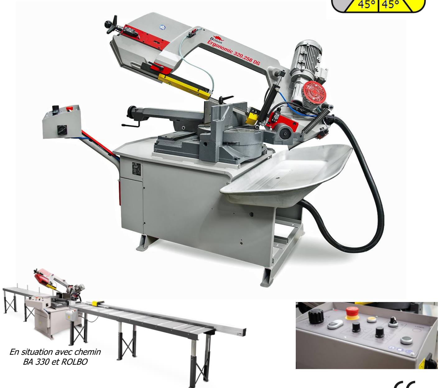
En situation avec chemin BA 330 et ROLBO