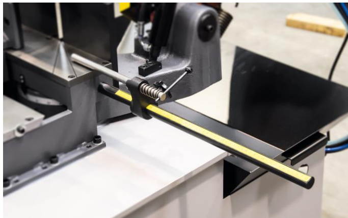
Butée de longueur 500 mm