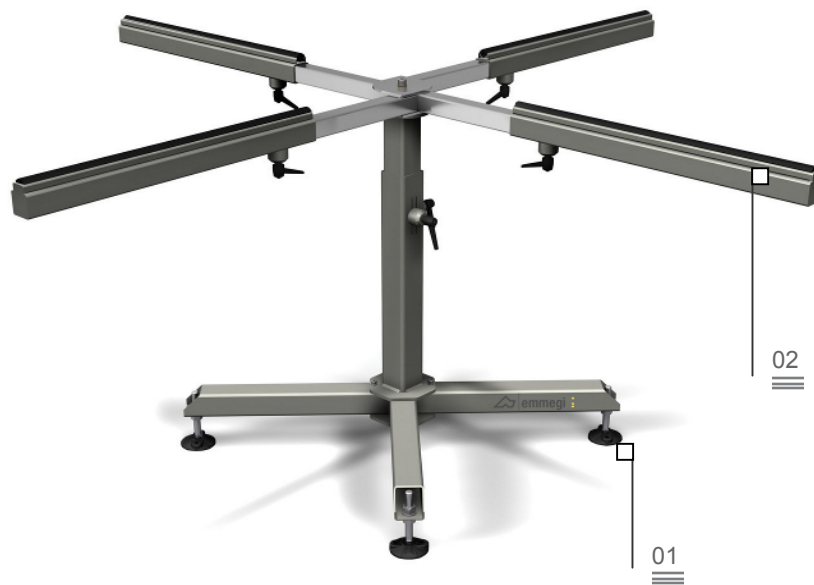
Table pour l'assemblage des garnitures

La mise au point d'un flux correct des matériels, qu'il s'agisse de produits semi-finis, de composants en cours de montage ou de produits finis, revêt une importance primordiale dans le processus de rationalisation et d'optimisation du cycle de production. La ligne Logistique d'Emmegi offre aux entreprises une réponse concrète à toutes les exigences de stockage, de manutention et d'assemblage.