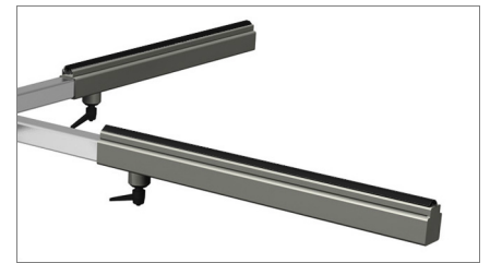
Surface en PVC antidérapant 02