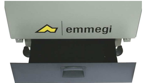
Bac à copeaux