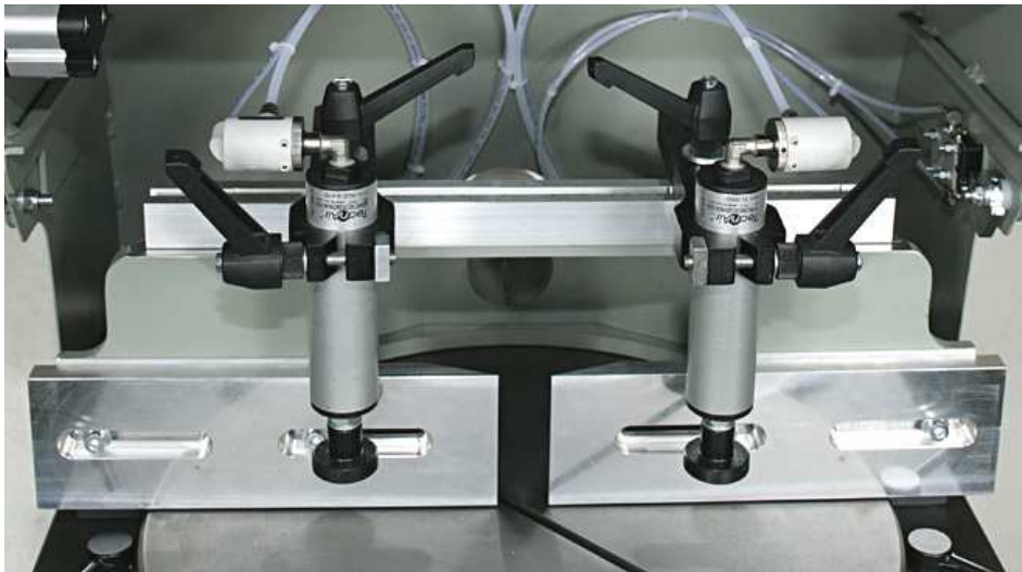
Etaux pneumatiques verticaux