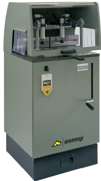
SCA 400 MINI M (version manuelle)

Permettant des coupes droites et biaisées jusqu'à +/- 70°. Conçue pour l'utilisation de fraises-scies à pastilles de carbure Ø 400 mm.