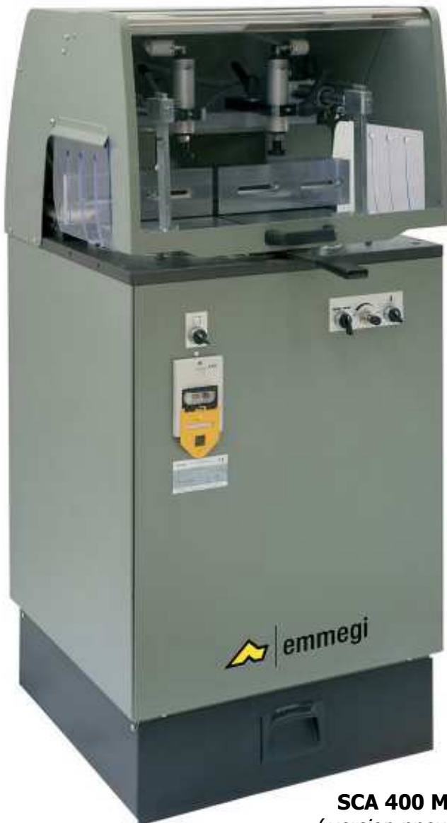
SCA 400 MINI P (version pneumatique)