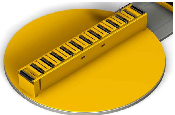
Amenage à rouleaux des châssis