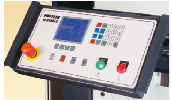
Pupitre à CN 4 axes (en option)