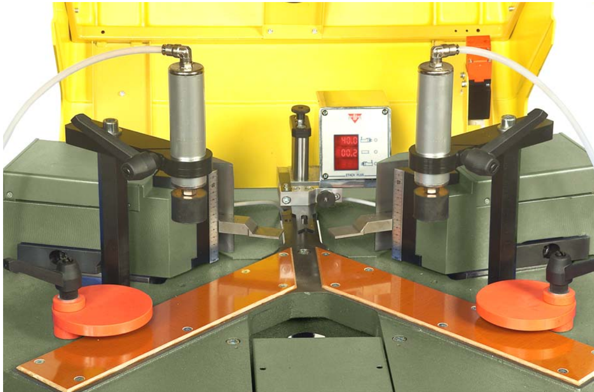
Détails des butées et des poinçons