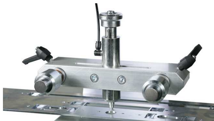
Doigt de copiage

Fraisage : 380 / 150 / 200 mm (x y z). Etaux : 190 x 225 mm (P x H).